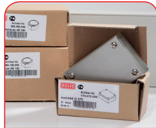
Servicio de muestras

Todo comienza con un asesoramiento personalizado. Le ayudamos en su proyecto y encontramos soluciones para cada necesidad. ¡Las soluciones a la medida del cliente son nuestra especialidad!