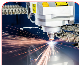
Procesado con láser

Nuestra oferta también incluye el grabado de su logotipo y otros elementos. Naturalmente diseñaremos los grabados en cualquier color que desee.