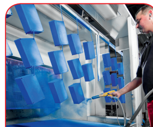
Recubrimiento en polvo

Nuestro propio centro de tratamiento láser nos permite elaborar cajas y placas de acero fino de manera rápida y fiable a la medida de sus requisitos.