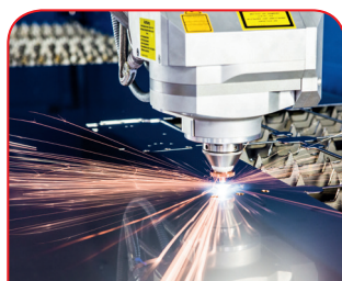
Procesado con láser

Nuestra oferta también incluye el grabado de su logotipo y otros elementos. Naturalmente diseñaremos los grabados en cualquier color que desee.