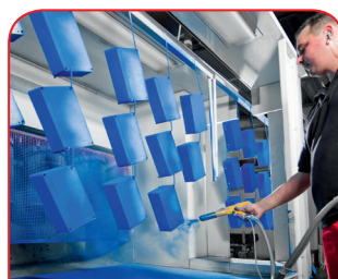
Recubrimiento en polvo

Nuestro propio centro de tratamiento láser nos permite elaborar cajas y placas de acero fino de manera rápida y fiable a la medida de sus requisitos.