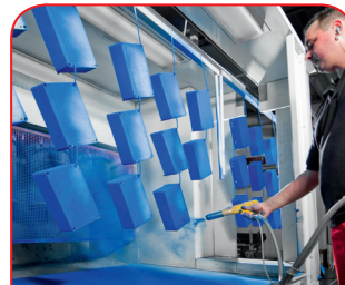
Recubrimiento en polvo

Nuestro propio centro de tratamiento láser nos permite elaborar cajas y placas de acero fino de manera rápida y fiable a la medida de sus requisitos.