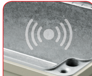
Cajas conforme CEM

La impresión digital resulta especialmente rentable para pocas unidades, así como para representar procesos o imágenes complejas.