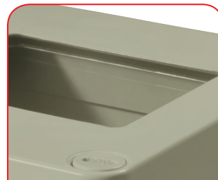
Protezioni per display

Per la protezione dei vostri componenti elettronici da interferenze elettromagnetiche proponiamo la custodia brevettata CONFORM: standard, economica ed in pronta consegna. Su richiesta può poi essere applicata l'opzione EMC anche sulle altre linee di custodie ROLEC.