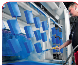
Lavorazione al laser

Grazie al nostro centro di taglio laser interno, siamo in grado di trattare custodie e piastre in acciaio inossidabile in modo rapido e affidabile in base ai vostri requisiti specifici.