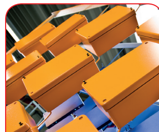
Verniciatura a liquido

Grazie al nostro centro di taglio laser interno, siamo in grado di trattare custodie e piastre in acciaio inossidabile in modo rapido e affidabile in base ai vostri requisiti specifici.